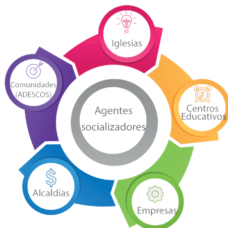
Figura 1 Agentes socializadores

Los agentes socializadores (Figura 1) que intervienen en la realidad salvadoreña y más cercanos a los CUBO que se han identificado son: Asociaciones de Desarrollo Comunal (ADESCOS), Centros Educativos (Básica, media y superior), iglesias (cualquier denominación), alcaldías y empresas (pequeñas, medianas y grandes), ya que por su trabajo en el territorio tienen el potencial de promover el trabajo que se está realizando en los Centros Urbanos, especialmente las dirigidas a la niñez y la adolescencia.